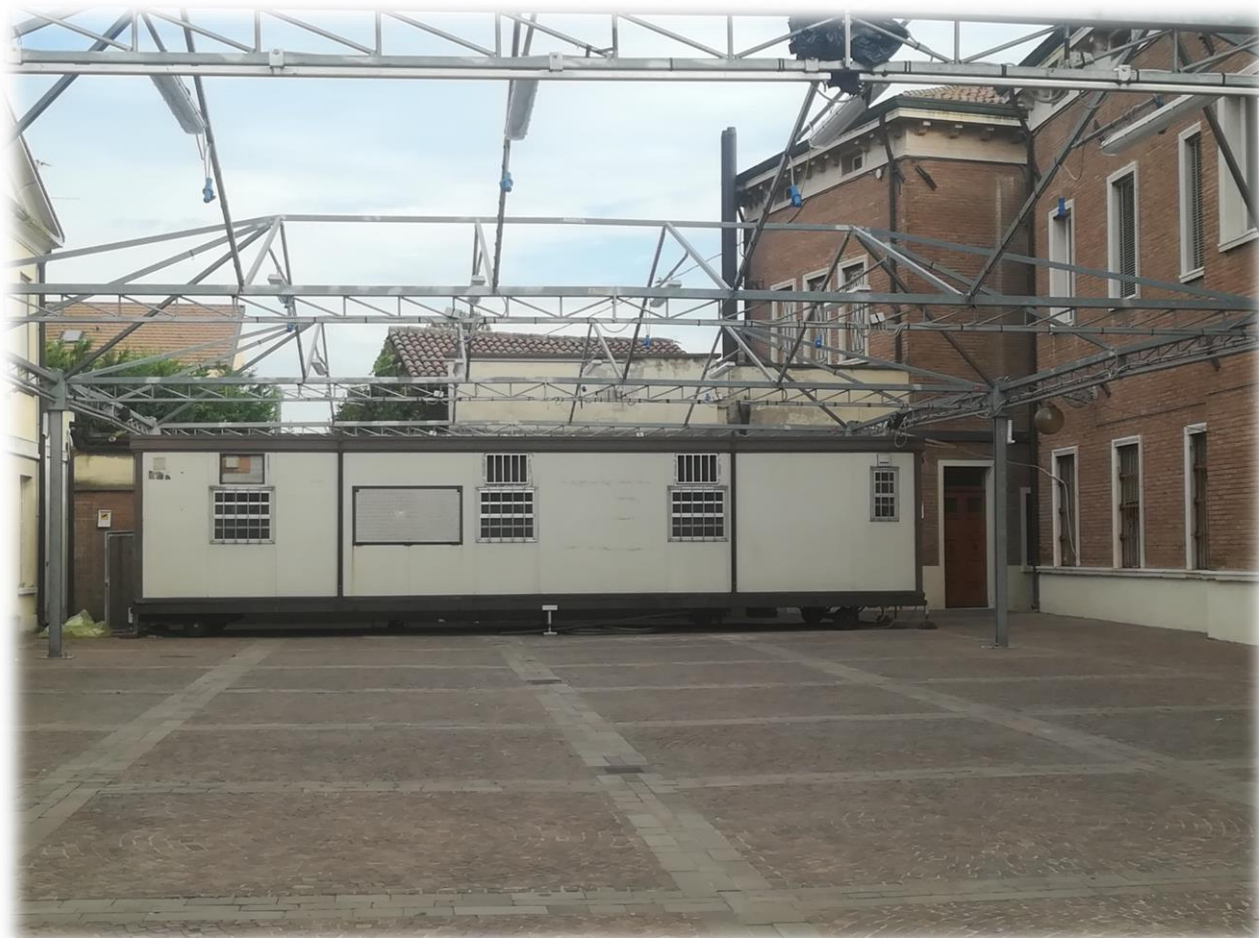
Immabile Cucina Pro – Loco P.tta Gonzaga, Sermide