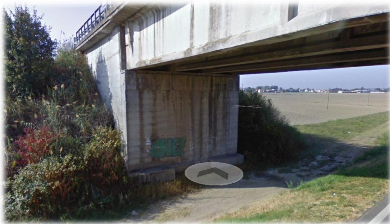
Parete sud - pilone del ponte di congiunzione tra Sermide e Castelmassa